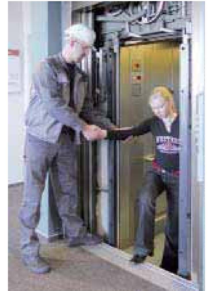
Asistencia rápida al pulsar el botón de alarma. Rescate de pasajeros atrapados, con AC TA y Servitel.