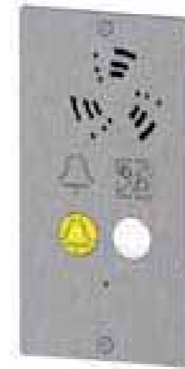
Botonera para montaje enrasado

Dispositivo para llamada de emergencia adaptable a las maniobras existentes.