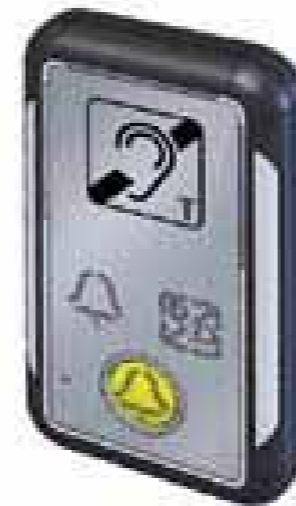
Botonera para montaje en superficie

Dispositivo para llamada de emergencia adaptable a las maniobras existentes.